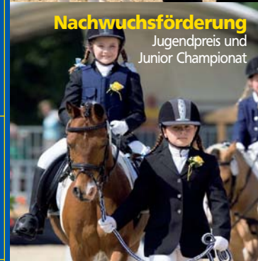
Nachwuchsförderung Jugendpreis und Junior Championat