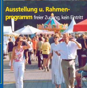
Ausstellung u. Rahmenprogramm freier Zugang, kein Eintritt