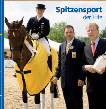
Spitzensport der Elite